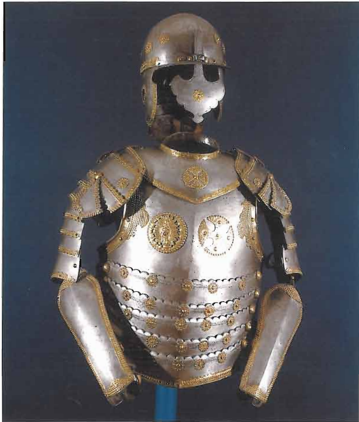
76. Zbroja husarska po Stanisławie Skórkowskim, sekretarzu króla Władysława IV, (typ starszy). Muzeum Wojska Polskiego w Warszawie.

Ich użyteczność bojowa budzi wątpliwości, niemniej stanowiły one najbardziej wyszukany wyraz karaceno-mody sarmackiej. Obok typów stylowo czystych pojawiały się egzemplarze o cechach mieszanych, hybrydalnych, płody imagacji zarówno szlachty mającej służyć w wojsku, jak i rodzimych