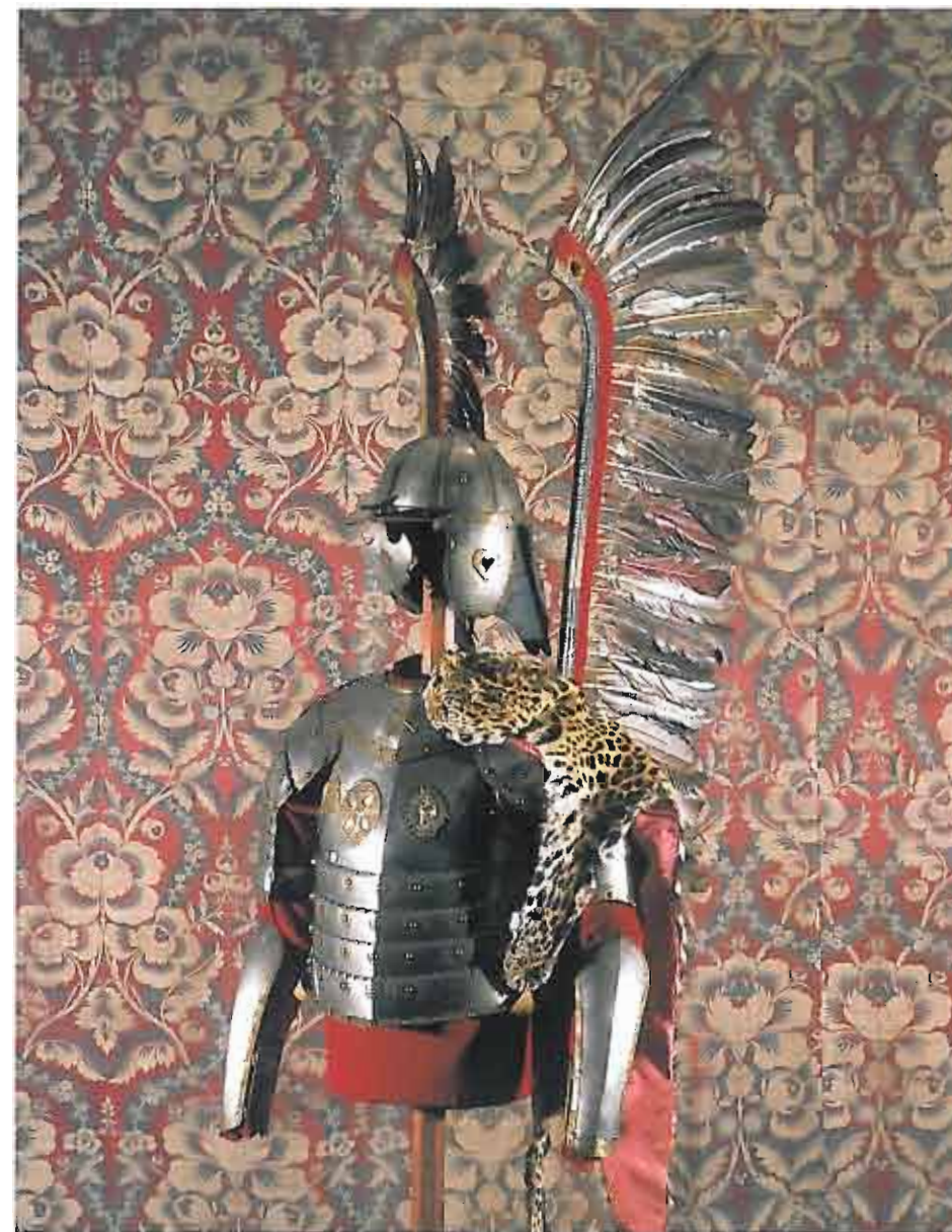
88. Zbroja husarska po hetmanie Stanisławie Jabłonowskim, typ młodszy ok. r. 1680 (skrzydła zrekonstruowane), Muzeum Narodowe w Krakowie.

Zachodzie, zwłaszcza w Niemczech, w Szwecji, w Anglii, w formacjach ciężkiej jazdy. Dzwon tego hełmu był półkulisty lub lekko owoidalny, zwykle wybity w sześć prządków biegnących od szczytu do otoka. Okazy angielskie i holenderskie mają zwykle dzwony wydłużone, dostosowane do przeważającego w tych krajach typu długogłowców. Hełm pappenheimer zaopatrzony był w daszek wycięty szpiczasto, z nosalem w formie wygiętej sztabki, umacnianej motylkową śrubą (podobnie jak nosale typowych szyszaków husarskich). Policzki pappenheimera miały kształt trójkątny i zaopatrzone by-