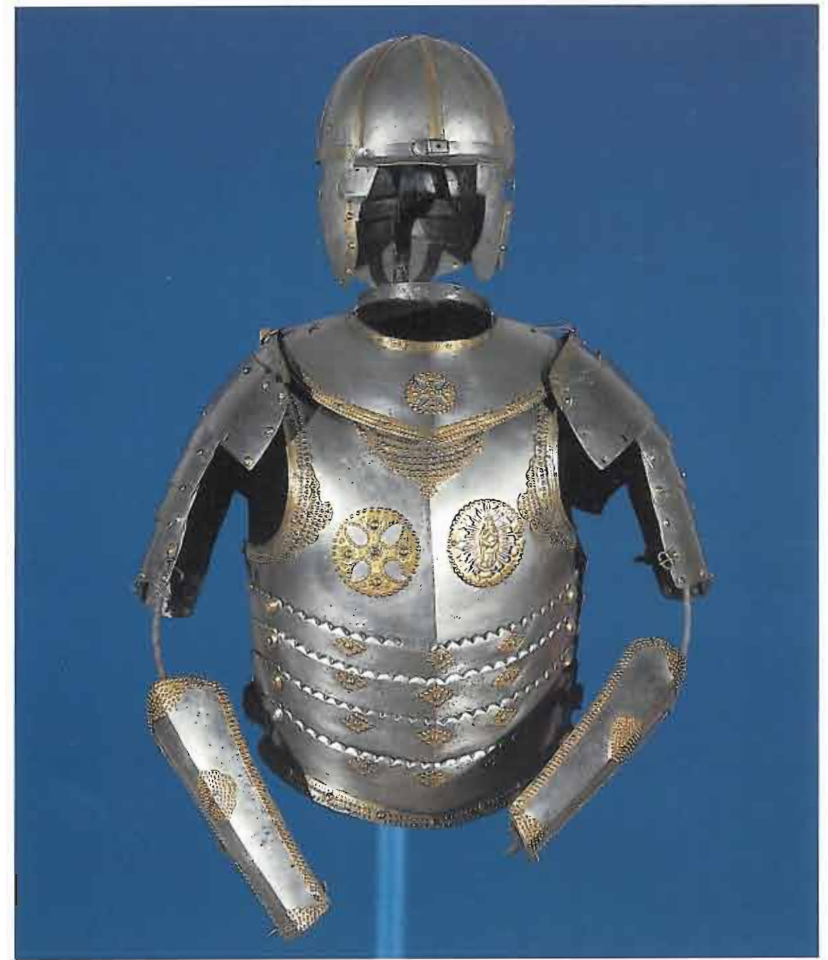
77. Zbroja husarska starszego typu, Muzeum Wojska Polskiego w Warszawie.

płatnerzy. Przykładem tego jest karaceno-kolczuga w Zbrojowni Kórnickiej, złożona z kolczego kaftana, wzmocnionego przez środek i po krawędziach łuskami, z łuskowego obojczyka, małych karwaszy przy rękawach kolczugi oraz płytowych osłon tydek - zupełnie na modłę turecką - przy kolczych spodniach.