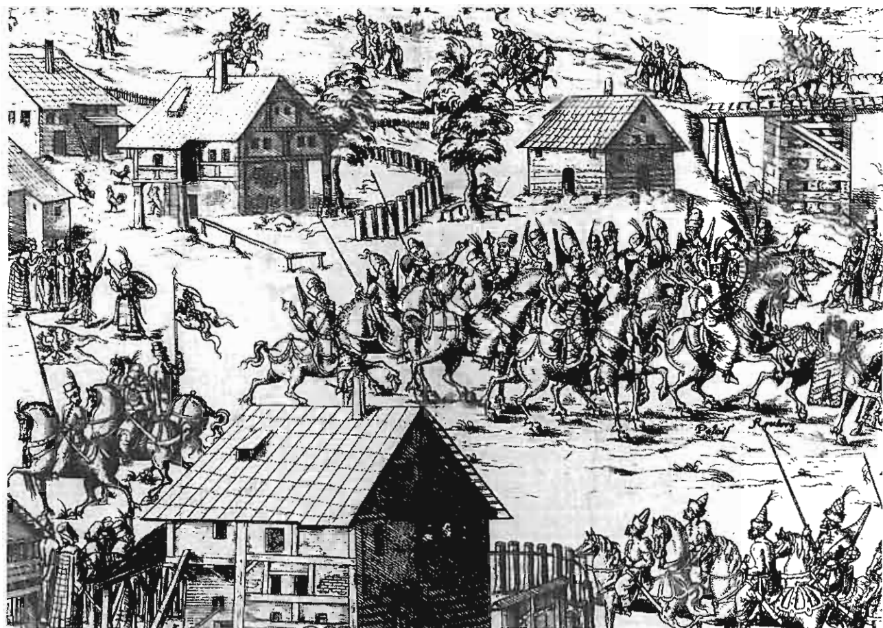
2. Husaria polska (u dołu jazda moskiewska) na rycinie przedstawiającej zjazd w Grodnie w r. 1568, ryc. M. Zündta wg rys. Adeltausera, Muzeum Czartoryskich w Krakowie.

Od czasów wczesnego średniowiecza podstawą polskiej siły zbrojnej, podobnie jak w innych krajach Europy, było pospolite ruszenie rycerstwa, wypełniającego obowiązek służby wojskowej z tytułu posiadania ziemi. Bitwa pod Grunwaldem w 1410 r. stanowiła szczytowe osiągnięcie owego pospolitego ruszenia, ale już wtedy pojawiły się w wojsku polskim rodzime oddziały zaciężne i najemne oddziały złożone z obcokrajowców, formowane na podstawie umowy o żołd, zwane w źródłach Curienses . System ten rozwijał się w ciągu XV stulecia. Wiadomo, że w 1424 r. Jagiełło wysłał na pomoc cesarzowi Zygmuntovi przeciwko husytom 5000 wyborowych jeźdźców, w roku zaś 1438 wojsko zaciężne w liczbie około 14000 - towarzyszyło królewiczowi Kazimierzowi w nieudanej próbie opanowania tronu czeskiego w Pradze. Pospolite ruszenie zawiodło w trzynastoletniej wojnie z Krzyżakami i tenże Kazimierz Jagiellończyk znów musiał się posłużyć oddziałami zaciężnych. Kolejna kompromitacja rycerstwa