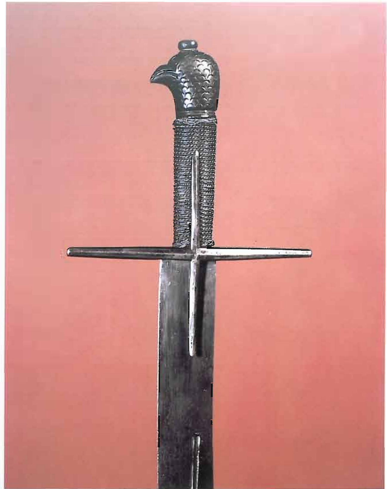
162. Szabla węgiersko - polska „orla”, ok. r. 1600, Muzeum Wojska Polskiego w Warszawie.

arsenału w Grazu wyliczono 247 austriackich anim, zanotowanych jako „ hungarische Husarenrüstungen mit geschiebten Prusten ”. Stosowano też dla nich potoczny termin „ Krebs ” czyli „rak”. W ciągu XVI w. wytworzyły się na Węgrzech i w Austrii paradne zbroje husarskie. Piękne egzemplarze husarskiej dekorowanej animy, z powierzchnią trawioną i złocaną w motywy roślinne, znajdują się w Wiedniu. Inny luksusowy okaz tego gatunku, inkrustowany półszlachetnymi ka-