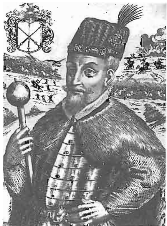
136. Hetman Jan Zamojski w zbroi husarskiej, z rękawami koleczynt lub na kolczudze, z narzuconą burką, ryc. z pocz. XVII w., Muzeum Czartoryskich w Krakowie.

ry, z rąk kawalerzystów lub żołnierzy broniących murów miasta. Wiadomo, że poza zbroją z płyt lorica segmentata wszystkie inne typy zbroi stosowane były przez Rzymian: płytowa zbroja torsowa, zbroje łuskowe i lamelkowe oraz kolczugi. Łuski i kolcze zbroje zostały wybrane przez wojowników okresu wędrówek ludów i przez rycerzy wczesnego średniowiecza. Trwały zwrot w stronę płyt rozpoczął się w późnym XIII w., ale pełna zbroja płytowa pojawiła się powtórnie dopiero około 1330 r. Do konstrukcji zbroi płytowej tego czasu stosowano także pasy z żelaza, ale rzymski sposób ich łączenia zapomniano, zamiast tego dawano podkład z tkaniny lub skóry. Ten typ zbroi udokumentowany jest najlepiej okazami odkrytymi na pobojowisku pod Wisby na Gotlandii (1361). Zbroje te sporządzano z szerokich folg żelaznych nakładanych od dołu do góry, gdyż służyły rycerzom walczącym z piechurami. Trzeba dodać, że wśród zbroi z Wisby są też okazy uszyte jak poncho, zbrojone płytami ułożonymi pionowo, a trafiły się również osobne osłony na pierś i na plecy, a więc napierśniki i napleczniki, łączone na ramionach i sznurowane po bokach. Już w XIV w. pojawiły się w Europie zbroje zbudowane z płyt odkrytych, od wewnątrz spojonych za pomocą rzemieni i nitów, a więc