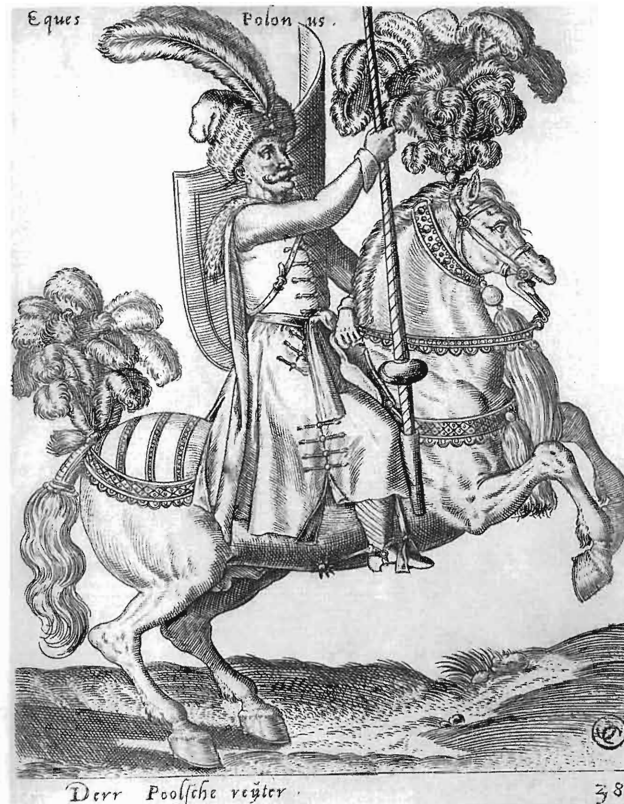
3. Husarz polski, ryt. Abraham de Bryn, Kolonia 1587, Muzeum Czartoryskich w Krakowie.

nastąpiła w wyprawie włoskiej Jana Olbrachta w 1497 r. i od tego czasu podstawą polskiej siły zbrojnej stały się wojska płatne. Tak więc dowódca oddziału mniejszej lub większej liczby jeźdźców, od 20 do 300 koni, układał się z królem co do warunków służby, wysokości żołdu i terminu zapłaty, a także wynagrodzenia szkód. Górski odszukał znaczną ilość rejestrów, czyli spisów owych rot jezdnych, przy czym najstarsza znana, comitiva czyli rota Rokosowskiego, pochodziła z 1471 r. Szlachcic socius , to jest towarzysz, zaciągał się do roty wraz z pocztem czeladzi, czyli pacholców albo pocztowych, a także pacholąt zwanych iunenes lub laicelli . Pocztowi, dobrze uzbrojeni, bezpośrednio służyli swemu panu w wyprawie i w bitwie, pacholęta nosiły miecze i kopie oraz dosiadały tęgich koni, aby je w potrzebie podstawić panom. W XV w. kopijnicy mieli konie rosłe i ciężkie - equi hastarii ; strzelcy zaś konie nieco lżejsze - equi sagitarii . Kopijnicy występowali w zbrojach pełnych z przyłbicami, czyli hełmami zakrywają-