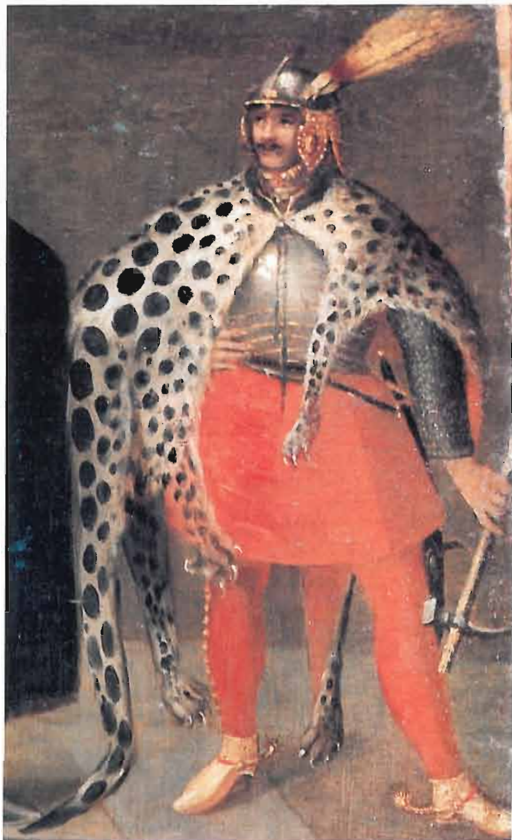
26. Husarz z „Tablicy Goluchowskiej” ok. r. 1620, Muzeum Narodowe w Poznaniu.