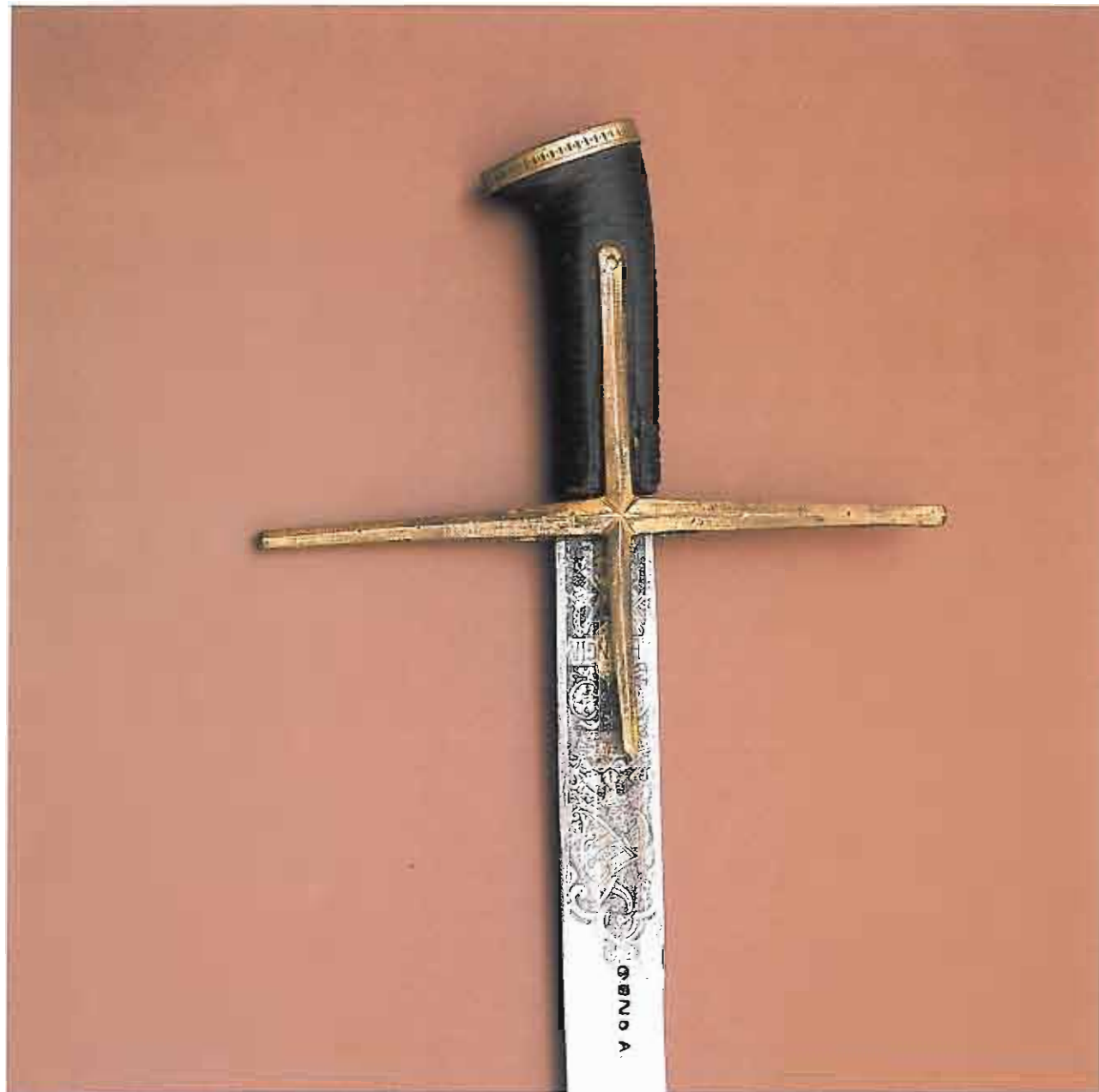
161. Szabla typu węgiersko - polskiego „batorówka gdańska”, w. XVI, Muzeum Wojska Polskiego w Warszawie.

chu kitysa. Austriacy husarze chronili ramiona kolczymi rękawami, lecz używali też płytowych rękawic. szyszak husarski miał swą niemiecką nazwę Zischägge . Te zbroje i szyszaki, zachowane w Grazu, powstały najprawdopodobniej w płatnerskich wytwórniach Styrii. Były surowo wykowane ( hammerfertig geschlagen ), czasem oksydowane ( blau angelaufen ) lub czernione ( geschwärzt ), nie miały innej dekoracji oprócz mosiężnych główek nitów. W roku 1625, w inwentarzu