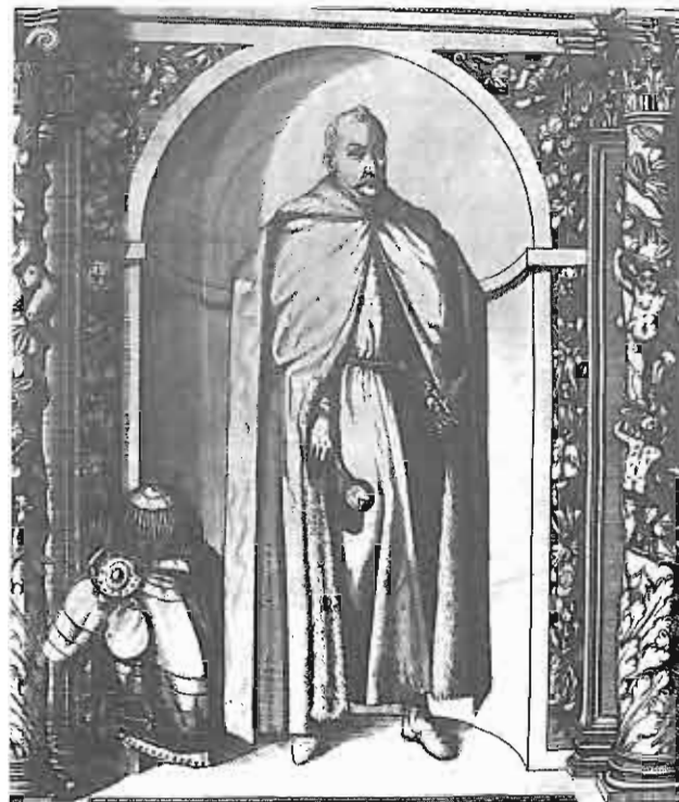
135. Hetman Jan Zamojski mający obok swą zbroję husarską z szyszakiem roboty norymberskiej, ryc. D. Custosa w dziele „Armentarium Heroicum”, Muzeum Czartoryskich w Krakowie.