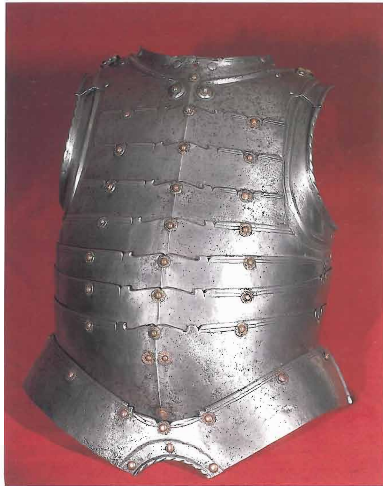
137. Napierśnik włoskiej animy, w. XVI, Muzeum Czartoryskich w Krakowie.

ry, z rąk kawalerzystów lub żołnierzy broniących murów miasta. Wiadomo, że poza zbroją z płyt lorica segmentata wszystkie inne typy zbroi stosowane były przez Rzymian: płytowa zbroja torsowa, zbroje łuskowe i lamelkowe oraz kolczugi. Łuski i kolcze zbroje zostały wybrane przez wojowników okresu wędrówek ludów i przez rycerzy wczesnego średniowiecza. Trwały zwrot w stronę płyt rozpoczął się w późnym XIII w., ale pełna zbroja płytowa pojawiła się powtórnie dopiero około 1330 r. Do konstrukcji zbroi płytowej tego czasu stosowano także pasy z żelaza, ale rzymski sposób ich łączenia zapomniano, zamiast tego dawano podkład z tkaniny lub skóry. Ten typ zbroi udokumentowany jest najlepiej okazami odkrytymi na pobojowisku pod Wisby na Gotlandii (1361). Zbroje te sporządzano z szerokich folg żelaznych nakładanych od dołu do góry, gdyż służyły rycerzom walczącym z piechurami. Trzeba dodać, że wśród zbroi z Wisby są też okazy uszyte jak poncho, zbrojone płytami ułożonymi pionowo, a trafiły się również osobne osłony na pierś i na plecy, a więc napierśniki i napleczniki, łączone na ramionach i sznurowane po bokach. Już w XIV w. pojawiły się w Europie zbroje zbudowane z płyt odkrytych, od wewnątrz spojonych za pomocą rzemieni i nitów, a więc